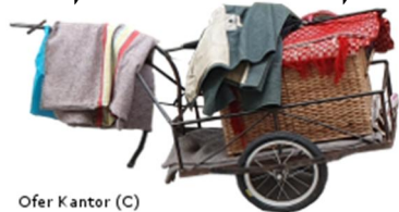
Ofer Kantor (C)

מהו סכום פיצויי הפיטורים שעל המעסיק לשלם לברק, לפי חוק פיצויי פיטורים ותקנותיו (סכום מקורב ומעוגל)?